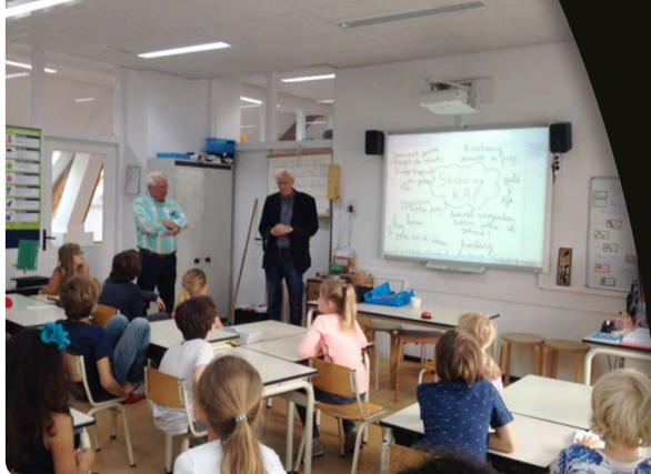
Basisschool De Koekoek