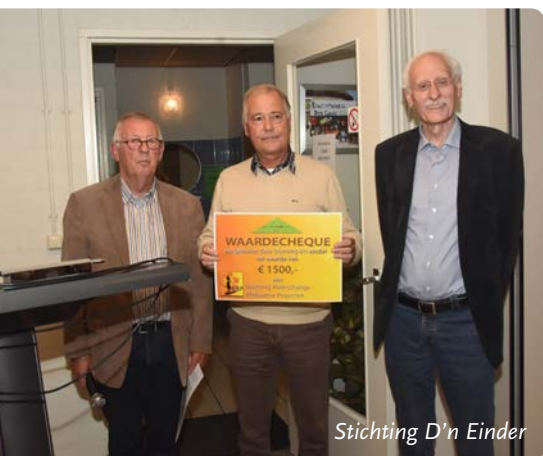
Stichting D'n Einder